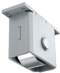
Rad Ø 92 mm | Wheel Ø 92 mm